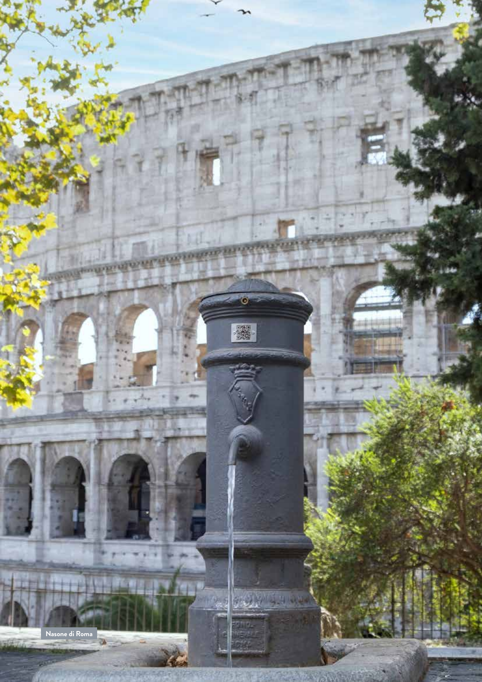
Nasone di Roma